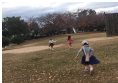
鬼ごっこをする 1年生の女子メンバーたち!