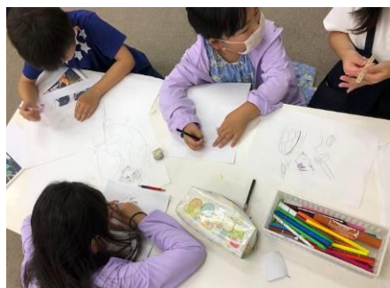
大人気「鬼滅の刃」の写し絵に挑戦!