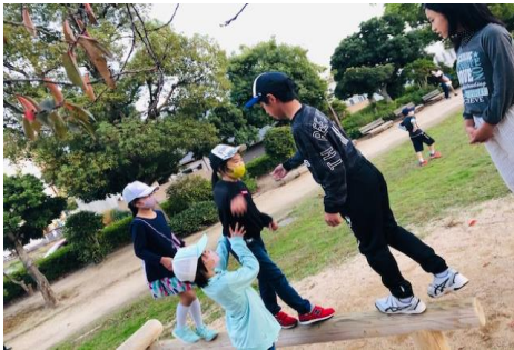
みんなで「ドンジャンケン！」誰が勝つかな？