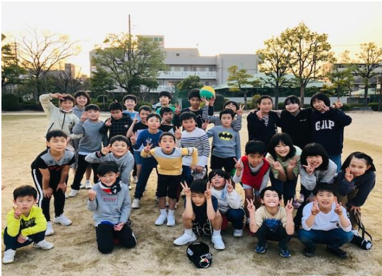
最後はみんなで記念撮影だっ！♪